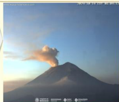
Imagen destacada de las últimas 24 horas

CON LA PARTICIPACIÓN DEL INSTITUTO DE GEOFÍSICA DE LA UNAM